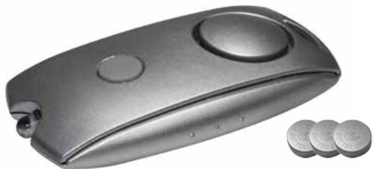
3 LR44 Knopfzellen im Lieferumfang enthalten